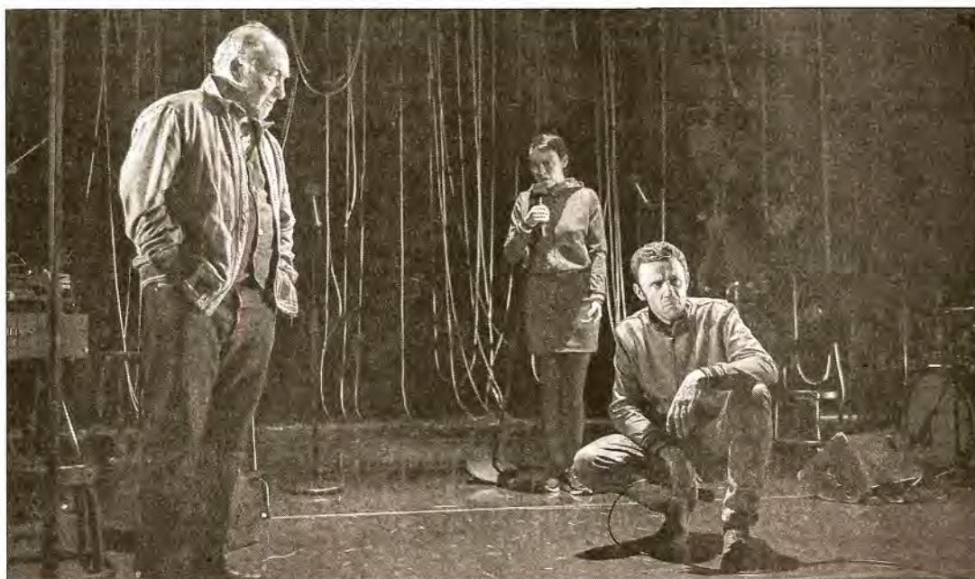
Un passionnant récit sans aucun temps mort.

Lune jaune n'est pas « jouée » mais « contée » par le chassé-croisé d'un récit haletant : les répliques et la musique sonnent à la manière d'un polar radiophonique. C'est vif, rythmé, mélange de poésie et de violence. Les rôles sont interchangeable, les répliques se succèdent avec ou sans micro, les silences sont habités comme jamais, si bien que le spectateur se sent pris dans la nasse d'un récit sans aucun temps