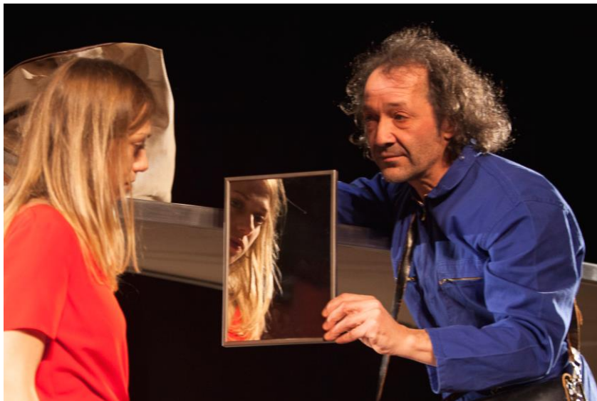
Entre Aujourd'hui et demain Photo de répétitions

Chacune des pièces pourra, par exemple, avoir une couleur dominante. De cette façon ils apparaîtront semblables avec quelques différences.