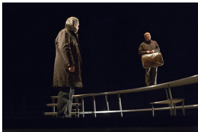
Avis aux intéressés Photo de répétitions

La langue de Daniel Keene est singulière, elle utilise peu de mots. C'est un théâtre où les situations dépassent les personnages. Il ne s'agira pas de mener un travail sur la psychologie de chacun d'eux. Les situations sont données par l'auteur. Il s'agira davantage de laisser entendre ce qu'ils ne disent pas. Les textes de Keene sont des textes « troués » où le spectateur devra entendre au-delà des mots. L'interprétation des acteurs devra être guidée par la volonté de ne pas avoir de « surplomb » sur leur personnage. Ils n'en savent pas plus que ce que les personnages nous disent dans l'instant.