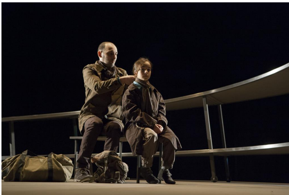
Elle souhaite que le monde ne soit pas tel qu'il est