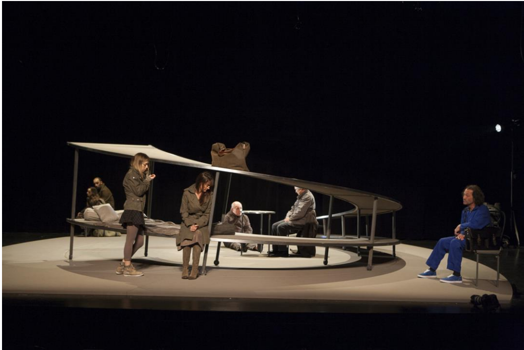
© Michel Nicolas – photo de répétitions